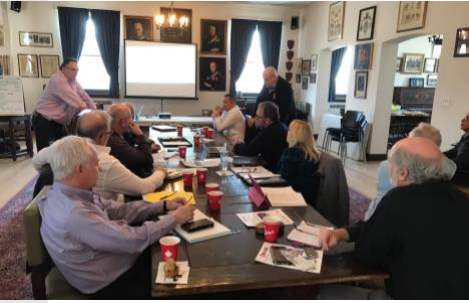
Formation des facilitateurs hiver 2020

L'hiver 2020 s'est concentré sur la préparation des rencontres du Forum de Respect du printemps. La formation des facilitateurs, le lancement des invitations au Forum de Respect, la création des outils de l'évaluation de programme et la mise en place des plans de développement des différents Outreach ont été au cœur des événements.