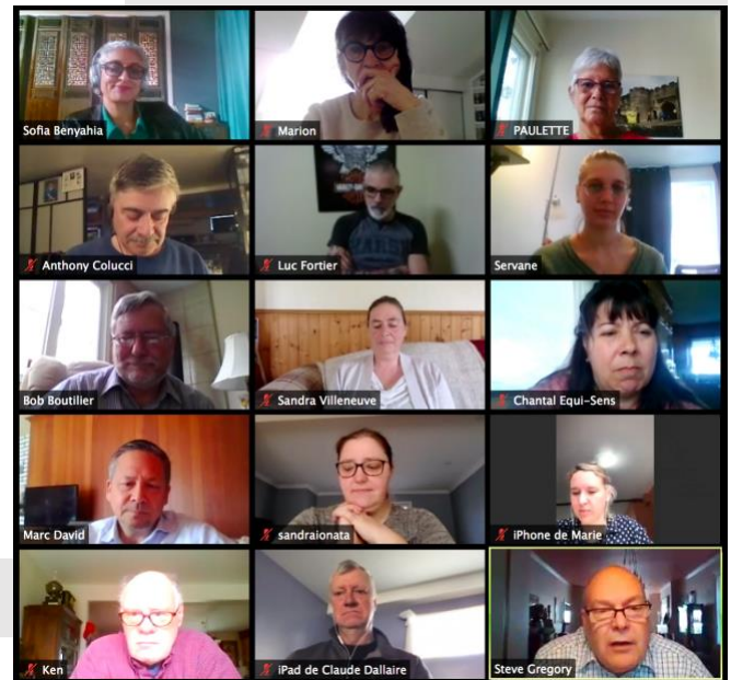
Forum de Respect – Montréal, QC printemps 2020

En juin 2020, l'équipe du Forum de Respect a mis sur pied son projet pilote de cartographie des services. S'appuyant sur une méthodologie innovante, nos facilitateurs ont mené quatre rencontres de travail avec les représentants d'organismes soutenant les vétérans, les pompiers, les policiers et le personnel paramédical. En cours d'évaluation, ce projet sera développé sur le plan national au cours des rencontres de l'automne prochain.